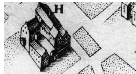
Der Fürstenhof auf einem Stich von Merian, 1653 (Stadtarchiv Wismar)